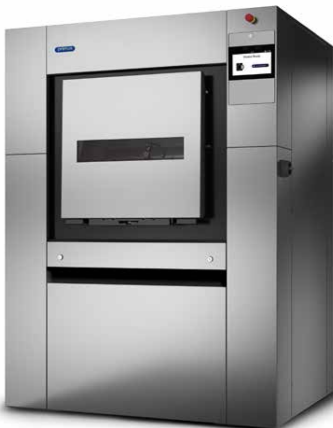
Ta slika prikazuje pralni stroj MXB360-500 z XControl FLEX PLUS